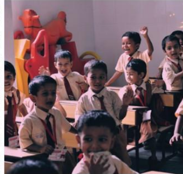
Un grupo de niños en un aula de una escuela en Bombay.

«también a través de otros medios a la India. En la India, un "normal" extranjero cambia sus pasaportes originales por unos argentinos y los ofrece a los niños de la India. Más tarde, cuando las autoridades los descubren y llevan a todos al Centro de Detención, sus papeles cambian a la pronta deportación, en el mejor de los casos, en el peor, largos meses de espera mientras se analiza y aclara su situación. Dos días después, sin embargo, una vez los datos de el grupo, se les acerca un agente y les habla en inglés. "En ese momento todo cambia", cuenta Alta y vuelve a silenciar. La joven es una funcionaria