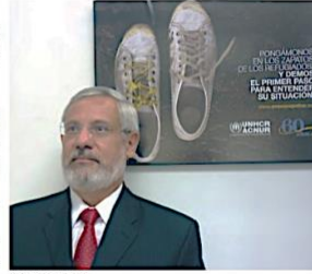
Romando Probst Álvarez, representante del Acnur para América Central, Cuba y México.

«Las multitudes en cuestión se encuentran en situación de desplazamiento forzoso (refugiados, solicitantes de asilo, desplazados internos, etcétera), y continúan cambiando constantemente. Para dar una fecha, a fines de 2012, por ejemplo, había un total de 4,2 millones de personas en el mundo en situación de desplazamiento forzoso. De ese total, unos 2,5 millones se encuentran bajo el mandato del Acnur. Había un total de unos 1,4 millones de refugiados en el planeta, de los cuales 1,1 millones pertenecen bajo el mandato de Acnur y casi 300 mil millones de personas son solicitantes de asilo, según la Agencia de Naciones